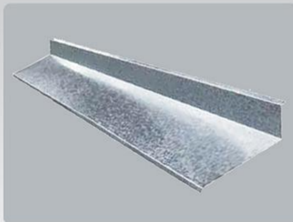
Rufo Tipo Pingadeira